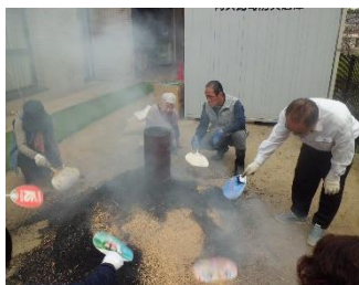
煙で燻されました。