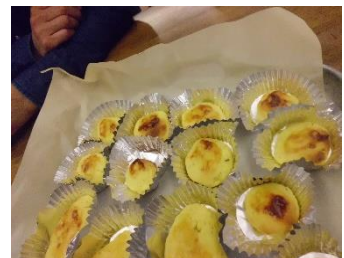
スイートポテトを作りました。