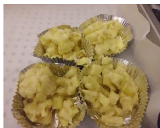
鬼まんじゅうを作りました。