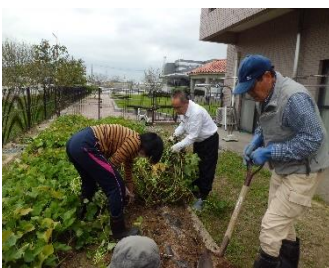
芋掘りをしました。